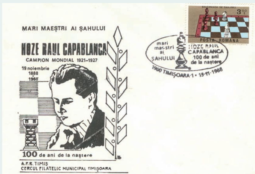
Sobre estampado dedicado al centenario del natalicio de Capablanca. Fue emitido en Rumanía en 1988 por el Círculo Filatélico Municipal de Timisoara.

Como una curiosidad, destacamos que en la francófona Chad, el nombre de nuestro ilustre jugador se transformó en Jean Paul , y en Djibouti, el ordenador debe haberse confundido y convirtió los acentos ortográficos en signos de interrogación: Jos? Ra?l Capablanca. Señalemos, finalmente, que, en 2002, los mozambicanos le quitaron el José. En varias ocasiones, ya otros le habían eliminado el Raúl.