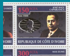
● Costa de Marfil