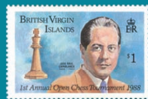
● Islas Vírgenes

La filatelia cubana ha honrado al ídolo ajedrecístico en siete emisiones: 1951, 1976, 1982, 1988, 1996, 2004 y 2008. Aunque no llevan el año, estas estampillas fueron emitidas en 1951.