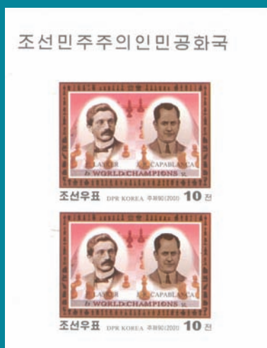
● Corea del Norte