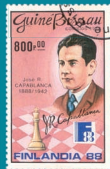
● Guinea Bissau